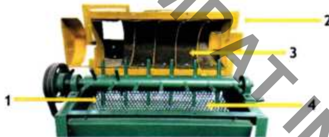
Gambar A.2.1.1. Mesin pemipil jagung tampak samping (kiri) dan depan (kanan)